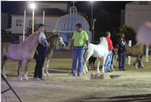
Presentes en la presentación oficial del evento.