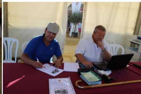
Welsh pony y paso español. Reconocimiento al RCEA. Presidente y Secretario WPE.