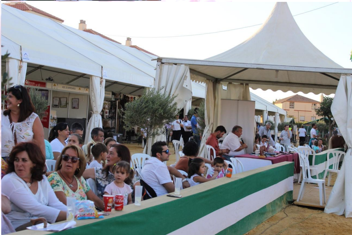
Un numeroso aforo esperaba expectante la exhibición de ejemplares de raza Welsh.