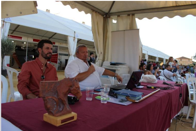
Presidente WPE y el escultor autor del magnifico trofeo.

29 SEP / 2 OCT X EDICION UNA PARÁ EN GINES 2016 FERIA AGRICOLA GANADERA Y COMERCIAL Cruzcampo